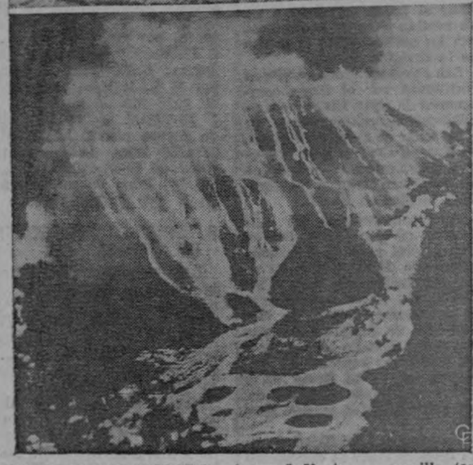
RIOS DE FUEGO Y NIEVE.—A regañadientes, un novillo (arriba) es sacado de las canchales congeladas del Río Missouri, en Townsend, Montana, durante la continuada ola de frío. Temperaturas bajo cero congelaron las aguas del río. Abajo, la lava hirviente llena el suelo del cráter Kilauea Iki de la isla de Hawaii, en la primera erupción del volcán desde 1955. La lava no pudo encontrar una salida para amenazar las granjas agrícolas cercanas o la mayor ciudad de la isla llamada Hilo