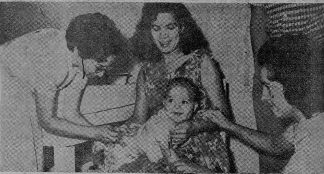
La gráfica recoge el instante en que en Calle Blancos se daba inicio a la vacunación