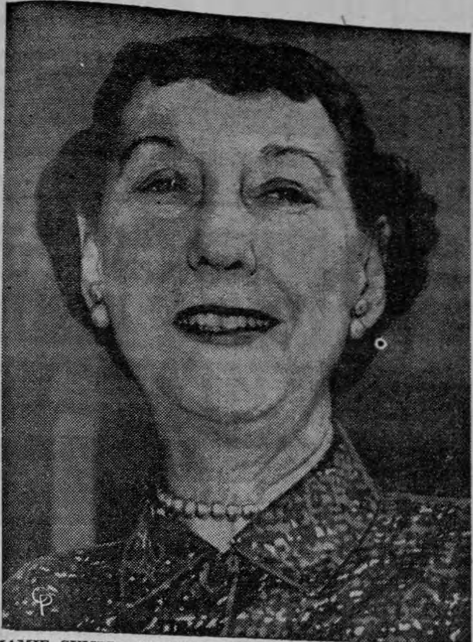
MAMIE CUMPLE 63 AÑOS. —Mamie Eisenhower, que acaba de cumplir 63 años, luce radiante mientras posa al frente de su bañía, en Augusta, Georgia, en el Club Nacional de Golf. Mientras la Primera Dama sonríe, el Presidente Eisenhower estaba preocupado por el tiempo nublado que amenazaba con echarle a perder una partida de golf